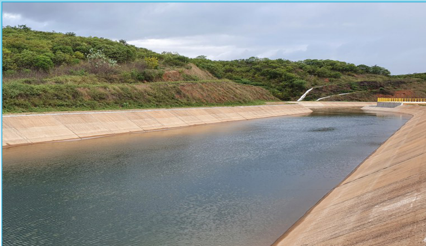
A outorga do PISF, emitida pela ANA em 2005, prevê que podem ser bombeados até 26,4m 3 /s

A Agência Nacional de Águas e Saneamento Básico (ANA) publicou a Resolução nº 145/2023 no Diário Oficial da União do dia 10 de fevereiro de 2023. Esse documento, aprovado anualmente pela ANA, define o Plano de Gestão Anual (PGA) do Projeto de Integração do Rio São Francisco (PISF) para 2023, o qual estabelece os volumes de água disponibilizados este ano à Paraíba e Pernambuco, no Eixo Leste, e a Pernambuco, Paraíba, Ceará e Rio Grande do Norte, no Eixo Norte. No PGA são definidas para quais finalidades de uso as águas da transposição do rio São Francisco poderão ser utilizadas, como: abastecimento humano, irrigação e demais usos.