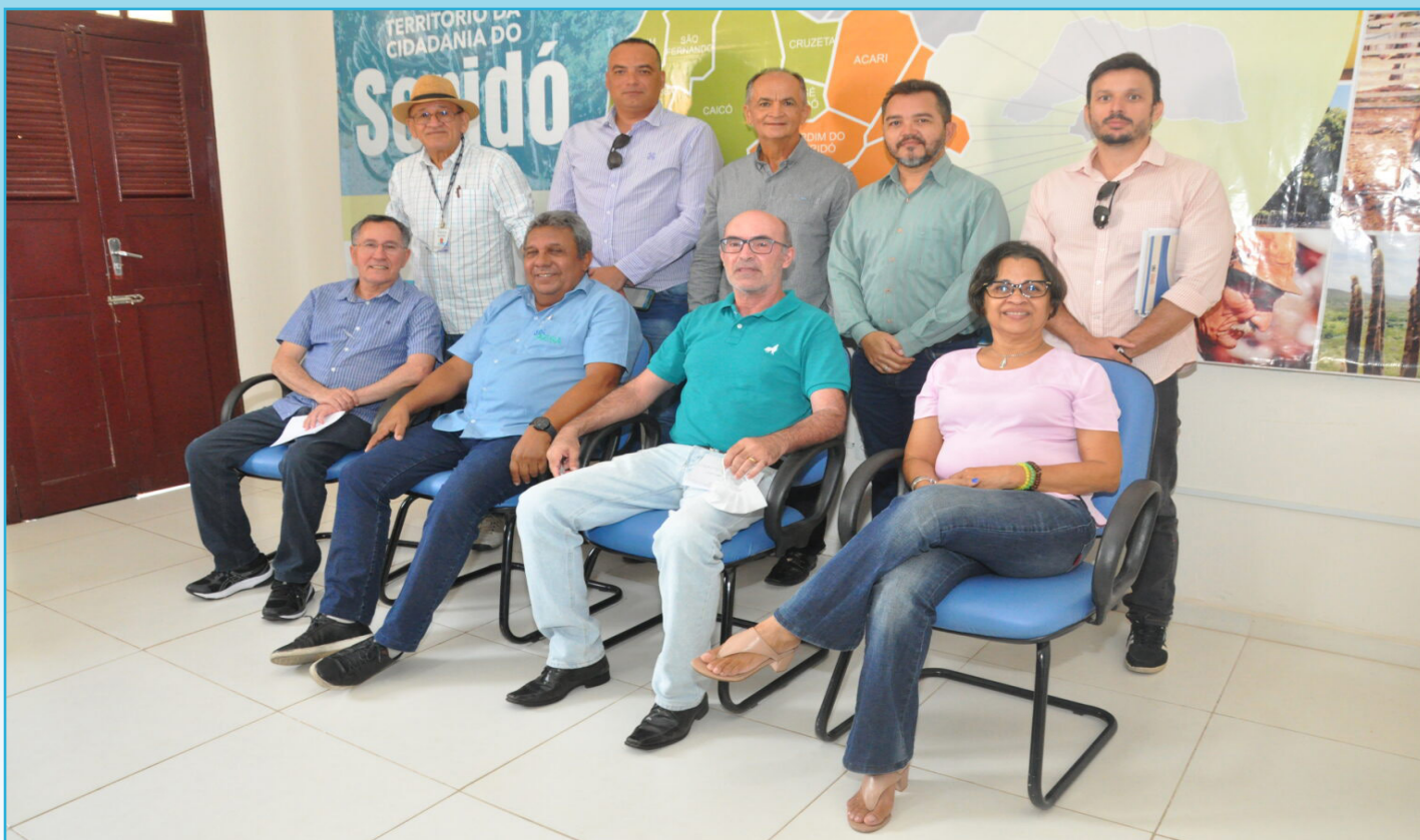
O mandato do Coordenador e da Relatora da CTPI coincidem com o mandato dos membros do comitê, 2022 - 2026